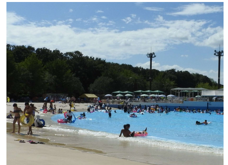
<波のプール (ウェイブプール) >