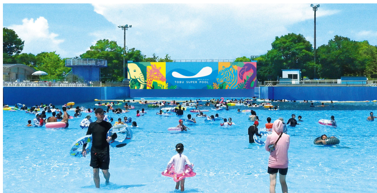
〔波のプール（イメージ）〕