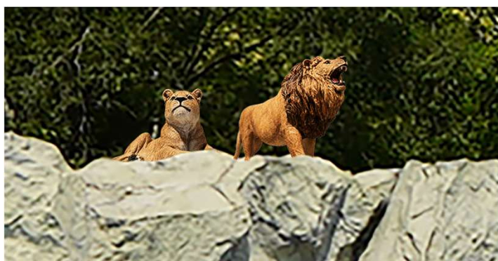
[動物モチーフ（イメージ）]

プールエリア帯の装飾を「SAFARI COAST」をテーマに一新。まるで大自然のサファリに飛び込んだかのような動物たちのモチーフや装飾がエリアを彩ります。また、乳幼児をお連れの方にも心から安心していただけるよう、プールエリア内に授乳やおむつ替えができる「屋外型ベビーケアルーム」を導入。さらに、「冷房完備の更衣室」を新設し、泳いだ後の着替えや、お子様のお世話も涼しく快適に行うことができます。