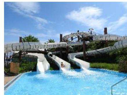
<タイガースプラッシュ>