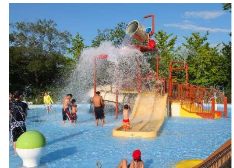
<じゃぶじゃぶアドベンチャー>