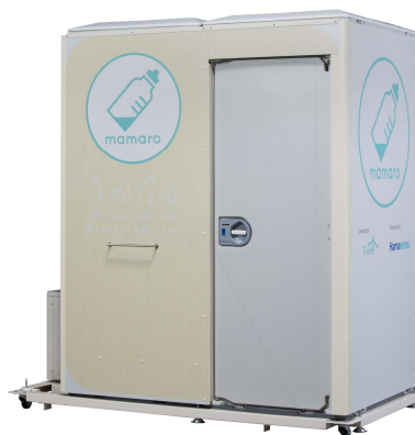
[屋外型ベビーケアルーム（イメージ）]