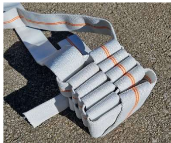
◀消防ホースを 編んで作るおもちゃ

内容：新サル山で使用するフィーダー（サルのおもちゃ）を作り、作ったおもちゃの中にアカゲザルのエサを詰めて、展示場内に設置します。その後、飼育係と一緒に展示場内を見学します。参加いただいたお客様には、限定ステッカーをプレゼントします。