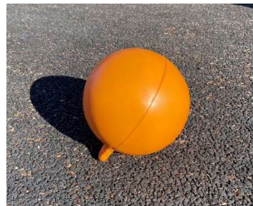
◀穴を空けて エサを詰めるブイ