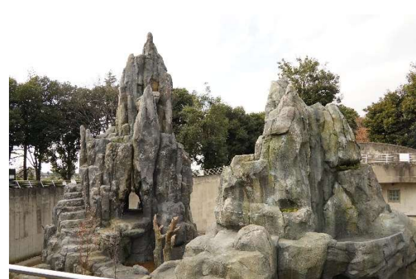
工事中の「新サル山(仮称)」<12/28撮影> 上段・・・展示場内から撮影 下段・・・観客通路から撮影