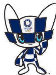
東京2020公式パートナー(旅行サービス)