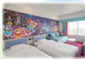
夢やファンタジーがテーマの「ウィッシュ」客室