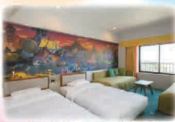
冒険や発見がテーマの「ディスカバー」客室

東京ディズニーセレブレーションホテルは、手軽にリゾートステイを楽しめるバリュータイプのディズニーホテルです。東京ディズニーリゾート・コーポレートプログラムにご所属の皆さまと、 そのご家族を対象に、客室料金を10%割引 にてご提供いたします。