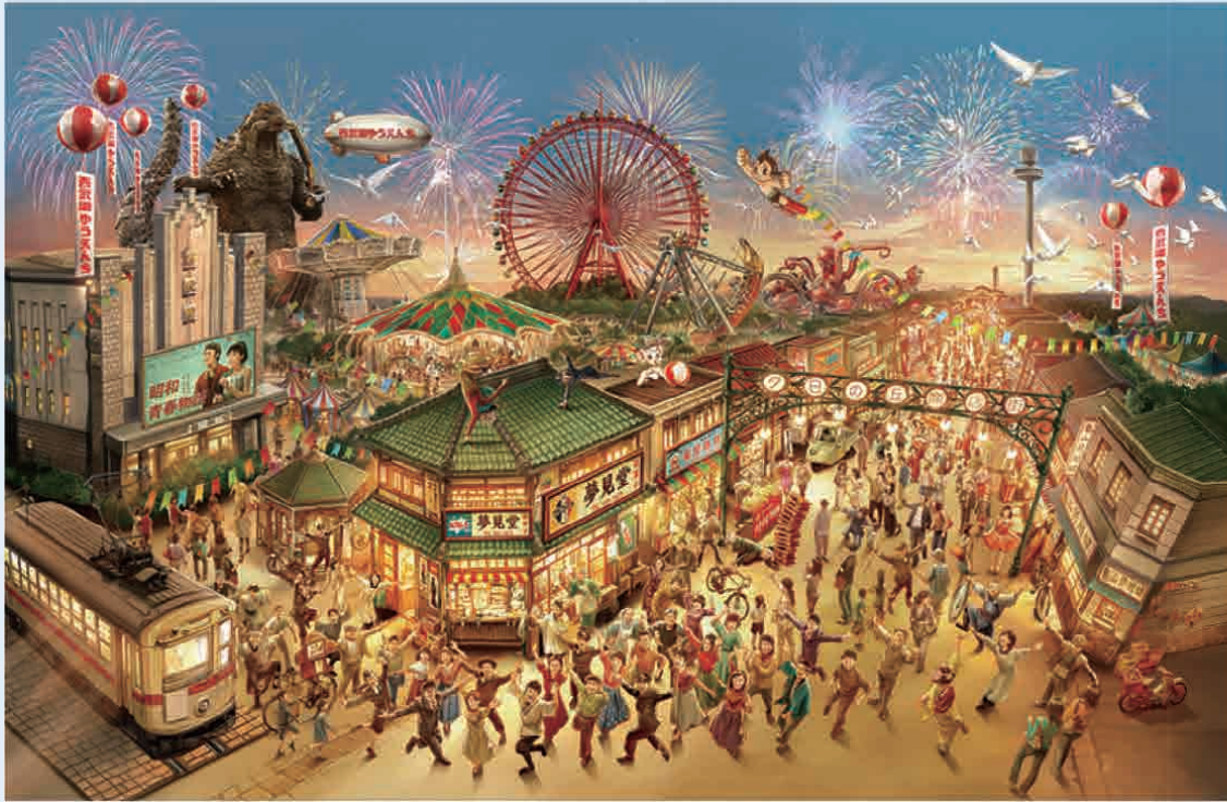
TM & © TOHO CO., LTD. © TEZUKA PRODUCTIONS

1960年代をイメージした‘あの頃の日本’の街並みを再現。新アトラクション「ゴジラ・ザ・ライド 大怪獣頂上決戦」、「鉄腕アトム」や「ジャングル大帝」が登場するファミリーエリア、圧巻のライブパフォーマンス。ワクワク・ドキドキの体験を楽しもう!!