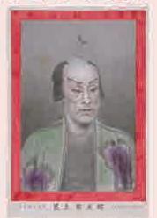
尾上菊五郎 一枚 明治8年(1875)頃