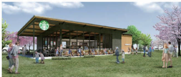
にこにこテラス店イメージ図

狭山市が推進する「入間川とことん活用プロジェクト」事業の一環として、スターバックスコーヒーが狭山市に初出店！事業区域の愛称どおり、その名も「狭山市入間川にこにこテラス店」です。