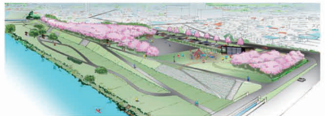
事業区域全体イメージ図

「入間川とことん活用プロジェクト」とは、河川敷中央公園を中心に、にぎわい創出と地域のイメージアップを目的として、狭山市が平成28年度から取り組んでいる事業です。店舗の近くには、お子さん向けの遊具も設置されています。桜のシーズンに、ぜひお楽しみください。