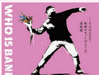
バンクシーって誰?展 8.21@-12.5@ (東京・天王洲) 寺田倉庫G1