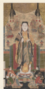
「聖徳太子皇形像・六部像」 桃山時代 16世紀、大阪・四天王寺